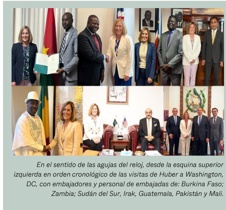
En el sentido de las agujas del reloj, desde la esquina superior izquierda en orden cronológico de las visitas de Huber a Washington, DC, con embajadores y personal de embajadas de: Burkina Faso; Zambia; Sudán del Sur, Irak, Guatemala, Pakistán y Mali.

En octubre de 2023, el mismo mes que Huber viajó a Guatemala, también viajó a Chad para reunirse con el primer ministro de Chad, el Ministro de Estado, el Ministro de la Mujer, la Familia y la Protección Infantil, y el Ministro de Salud Pública y Prevención. Durante su visita, presentó el trabajo del IWH que “defiende la vida humana, la salud de la mujer, la solidaridad y la cultura y religión”. Además, discutió “la importancia de [la DCG]” con el primer ministro Salih Kebzabo. Según ciertas fuentes, el gobierno de Chad está en proceso de determinar si unirse a la DCG y también está revisando la propuesta de Protego, que estaría bajo la supervisión del ministerio de salud. Además de Chad, Panamá y Perú posiblemente firmen la DCG. Huber informó esto el 17 de noviembre de 2023, en la V Cumbre Transatlántica, organizada por el grupo antiderechos Red Política por los Valores en la Ciudad de Nueva York, en las Naciones Unidas. Esto llevaría el total de signatarios de la DCG a 39.