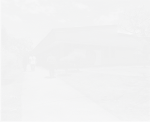
» En el hospital de Rivas operarán a la niña de cuatro años.