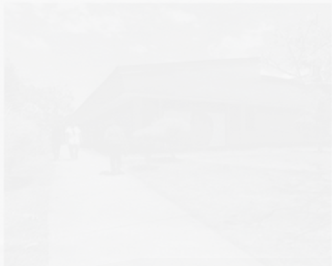
En el hospital de Rivas operarán a la niña de cuatro años.

Atentado a la integridad de la niña de cuatro años