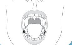
Misoprostol par voie buccale